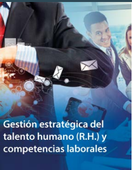
Gestión estratégica del talento humano (R.H.) y competencias laborales