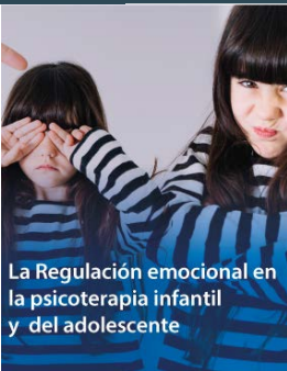
La Regulación emocional en la psicoterapia infantil y del adolescente