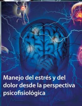
Manejo del estrés y del dolor desde la perspectiva psicofisiológica

¡Obtén informes desde tu teléfono celular, donde quiera que te encuentres!