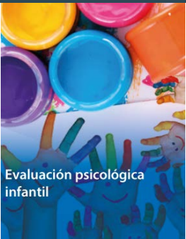
Evaluación psicológica infantil